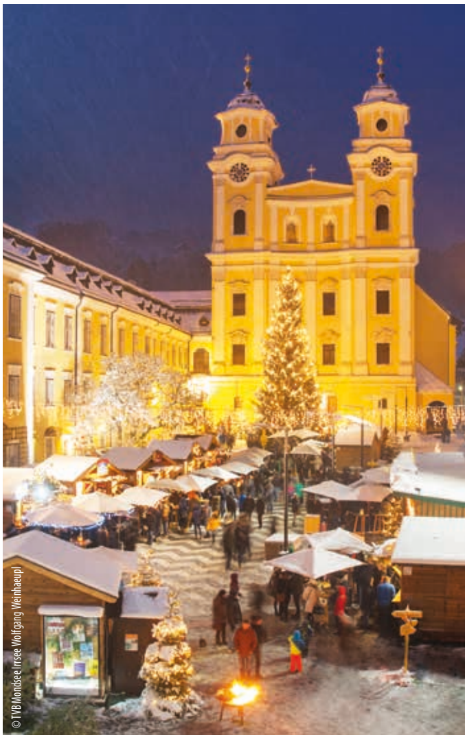
Bezahlte Anzeige