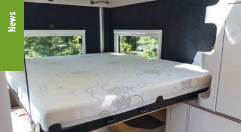
Rhön Camp Renegard